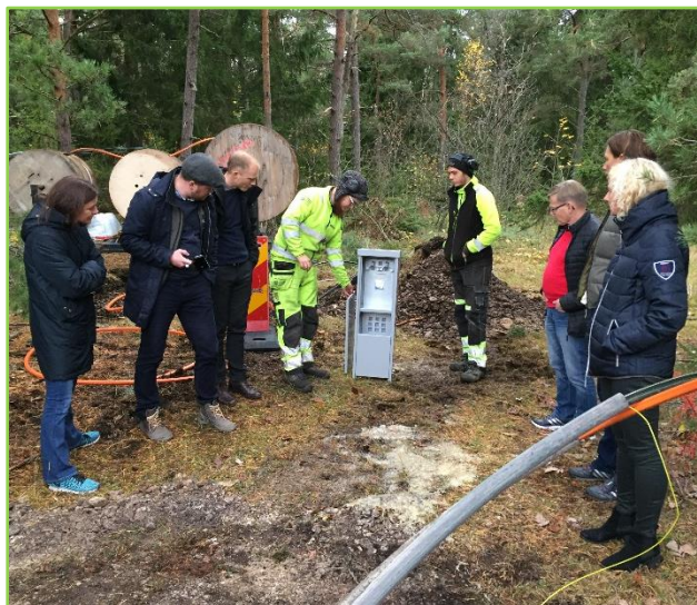
Bredbandskoordinatorer på studiebesök på Gotland

För att stödja koordinatorerna i sitt arbete arrangerar sekretariatet för bredbandskoordinatorer regelbundet träffar med syfte att bidra till erfarenhetsutbyte, kontaktnät och kompetensutveckling. Det senaste mötet hölls på Gotland där koordinatorerna bland annat fick se praktisk fiberförläggning med olika förläggning-metoder och diskuterade förläggning av robusta fibernät. Bredbandskoordinatorerna har också deltagit i PTS bredbandsskola , en utbildning inom PTS och andra berörda myndigheters verksamhetsområden, och examinerades vid det sista tillfället i september.